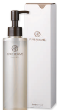
『美容液クレンジング』 約2ヵ月分 180ml 5,940円(税込)